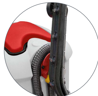
HAK NA NARZĘDZIA

Nakrętka miarowa do dodawania właściwego procentu